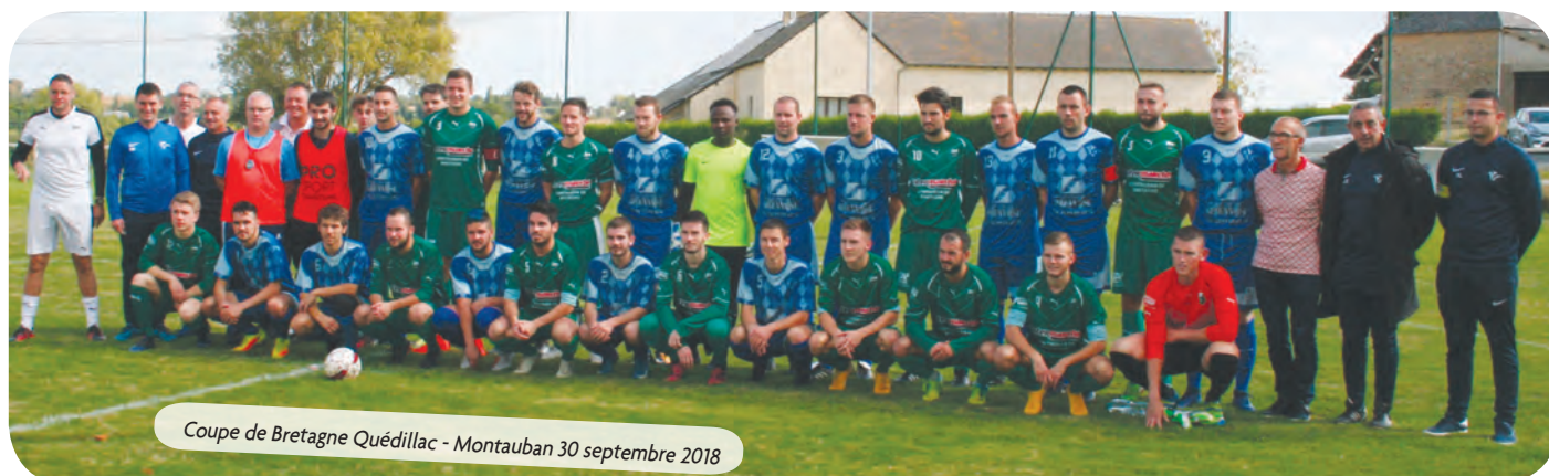
Coupe de Bretagne Quédillac - Montauban 30 septembre 2018

Le club souhaiterait avoir ou former des encadrants ou bénévoles pour toutes les catégories