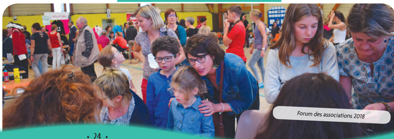
Forum des associations 2018