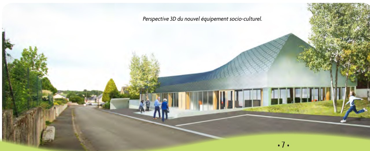
Perspective 3D du nouvel équipement socio-culturel.