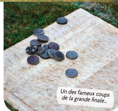
Un des fameux coups de la grande finale...