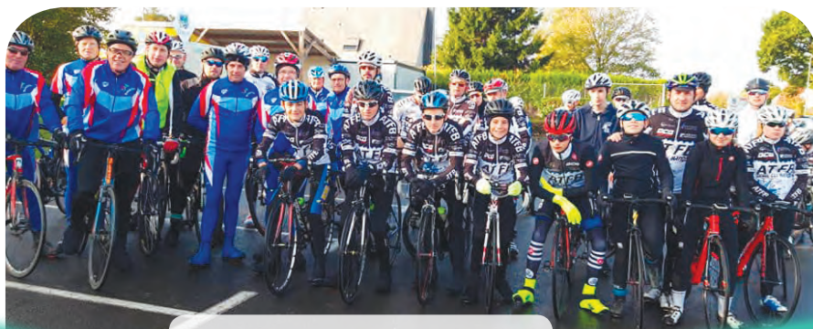
Sortie vélo du DCQ et des cyclos de Quédillac